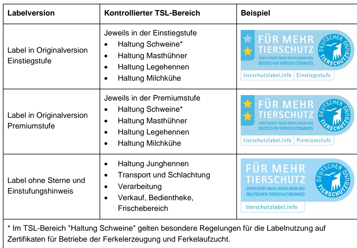
Tabelle 5: Labelnutzung auf Zertifikaten