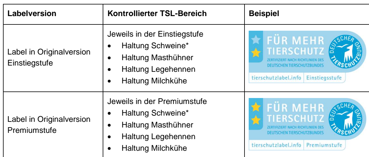
Tabelle 5: Labelnutzung auf Zertifikaten

Auf Zertifikaten kann das Tierschutzlabel gemäß → Richtlinie Gestaltung je nach kontrolliertem TSL-Bereich folgendermaßen und genutzt werden (Tabelle 5):